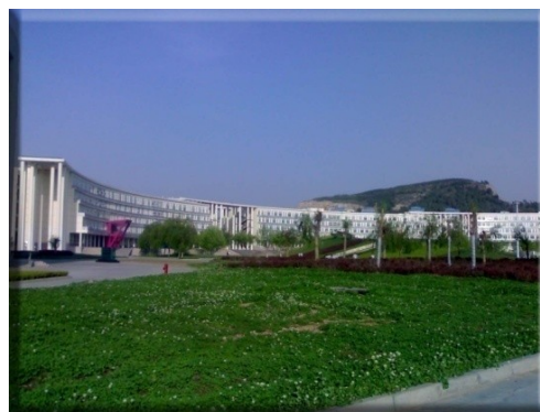
济南数据处理中心 →