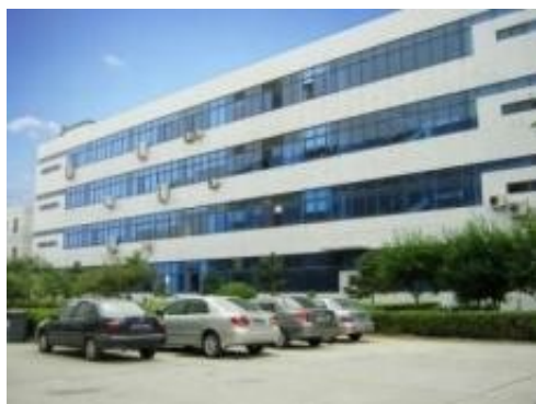
← 北京大兴数据处理中心

东方道速拥有国家测绘地理信息局颁发的甲级测绘资质，高新技术企业认定证书，ISO 质量体系证书等，自主研发软件著作权等 56 项。2008 年 2 月山东东方道速落户济南，公司独有的智能化、大规模信息处理系统，为各类用户提供高质量的定制数据处理服务，在汶川地震、玉树地震、青岛奥帆赛浒苔监测、北部湾漏油事件等重大事件和项目中与全球各国政府、企业用户建立良好的合作关系，成为了全球最具竞争力的空间数据处理服务商。